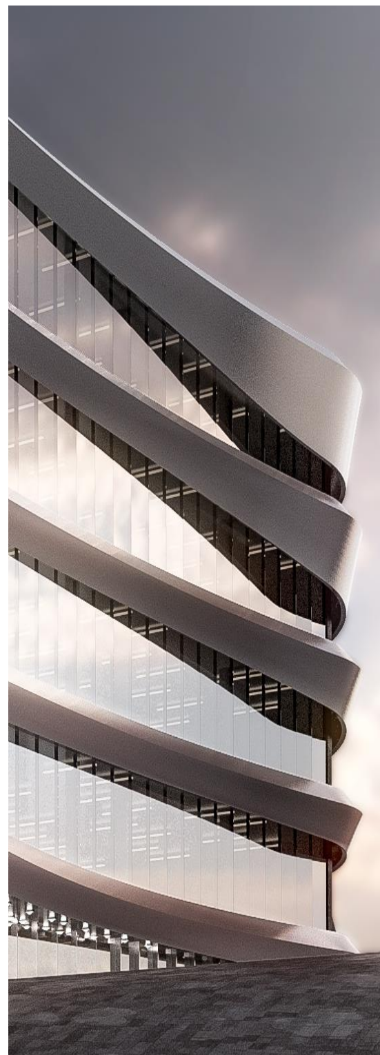
Arcadia Center - Milano Via Grosio